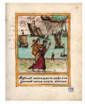
Manuscrit de la Bible, 1487, Université Catholique de Lille, Lille, France