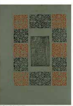
Manuscrit de la Bible, 1487, Université Catholique de Lille, Lille, France