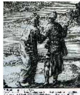
Manuscrit de la Bible, 1487, Université Catholique de Lille, Lille, France

Université de Lille 3 www.univ-lille3.fr