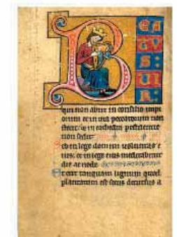
Manuscrit de la Bible, 1487, Université Catholique de Lille, Lille, France