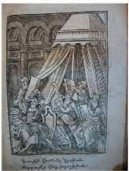
Manuscrit de la Bible, 1487, Université Catholique de Lille, Lille, France