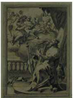
Manuscrit de la Bible, 1487, Université Catholique de Lille, Lille, France

Université de Lille 3 www.univ-lille3.fr