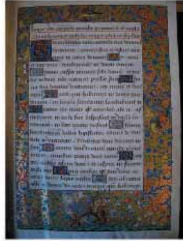
Manuscrit de la Bible, 1487, Université Catholique de Lille, Lille, France