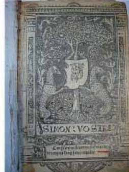
Manuscrit de la Bible, 1487, Université Catholique de Lille, Lille, France