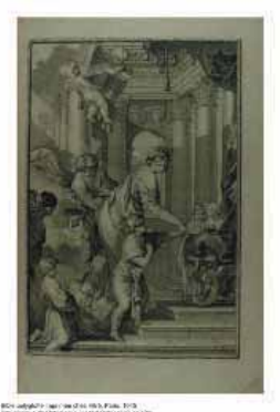
Manuscrit de la Bible, 1487, Université Catholique de Lille, Lille, France