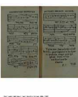
Manuscrit de la Bible, 1487, Université Catholique de Lille, Lille, France