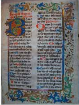
Manuscrit de la Bible, 1487, Université Catholique de Lille, Lille, France

Université Catholique de Lille www.univ-catholille.fr