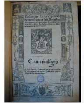
Manuscrit de la Bible, 1487, Université Catholique de Lille, Lille, France