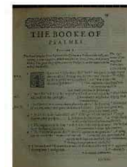
Manuscrit de la Bible, 1487, Université Catholique de Lille, Lille, France